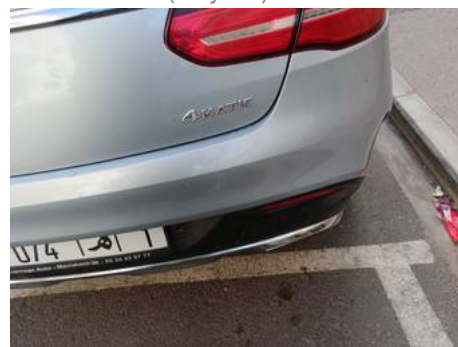
Bouclier arrière (Rayure)