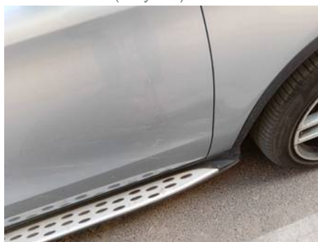
Porte avant droite (Rayure)