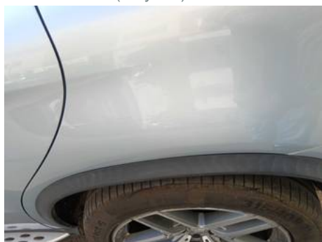
Aile arrière gauche (Rayure)